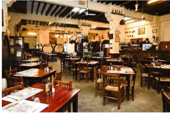
Celler Sa Premsa. Palma