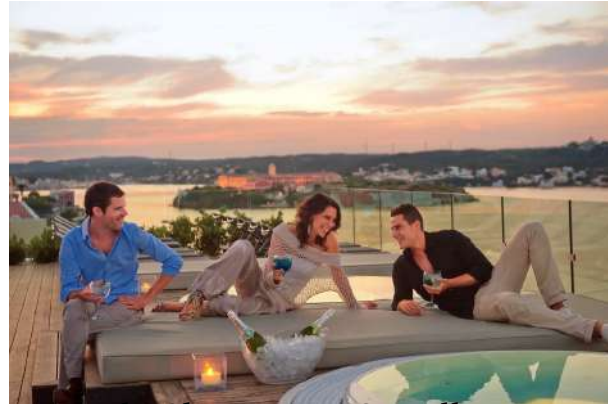
Blu Sky Bar. Es Castell.