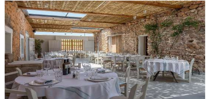
Oleoteca Ses Escoles. Portinatx.