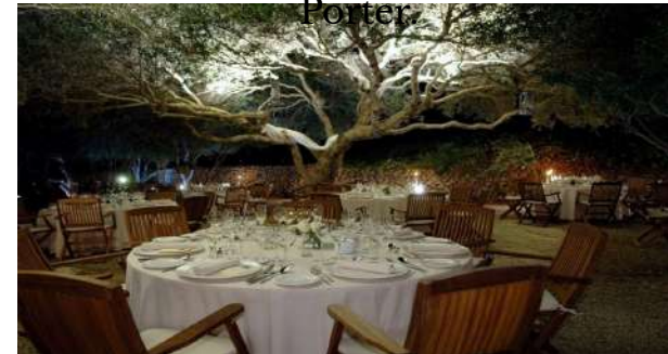
Alcaufar Vell. Alcaufar.