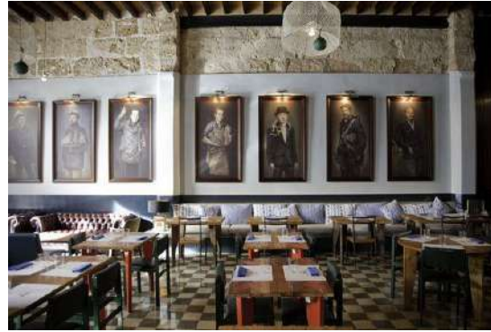
Patró Lunares. Palma