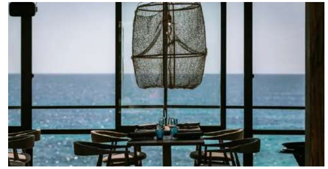
UM Beach. Puerto Portals.