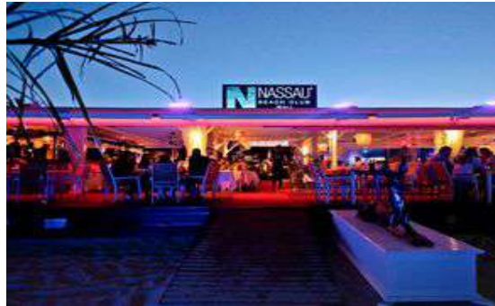
Nassau Beach Club. Playa d'en