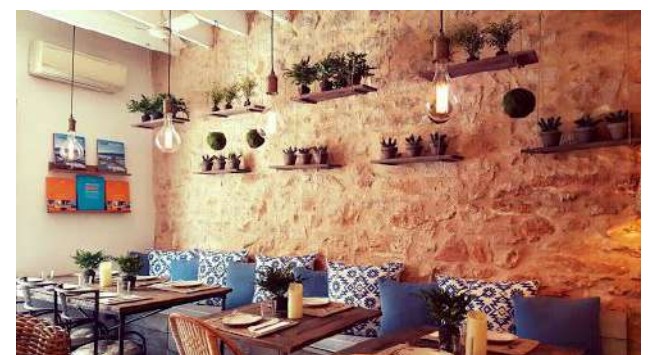
Cassai. Ses Salines.