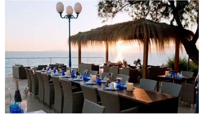
Mhares Sea Club. Llucmajor.