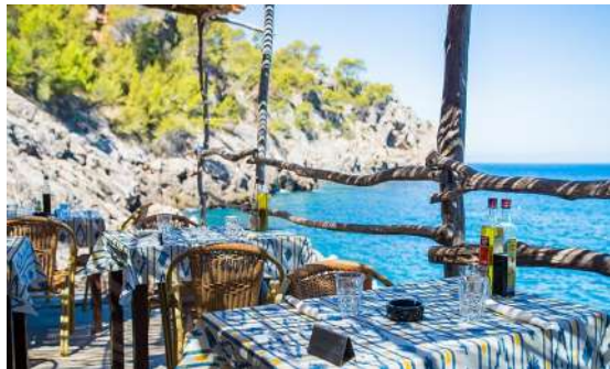
Ca's Patró March. Deià.