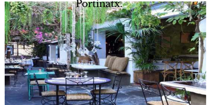
La Brasa. Dalt Vila.