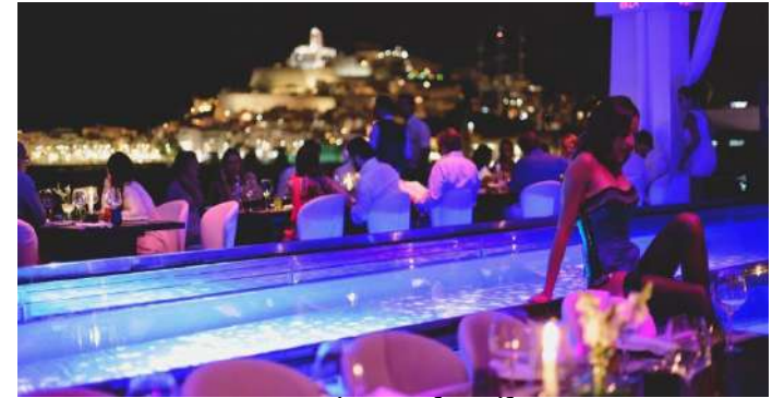
Lío. Dalt Vila.