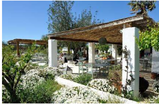
Aubergine. San Miguel.