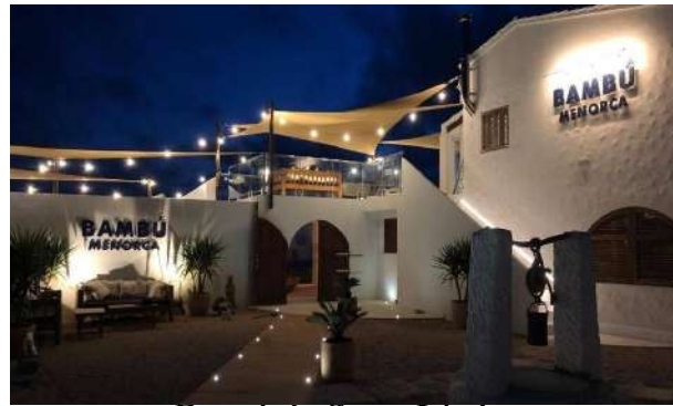
Bambú. Sant Lluís.