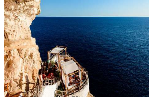
Cova d'en Xoroi. Cala En Porter.