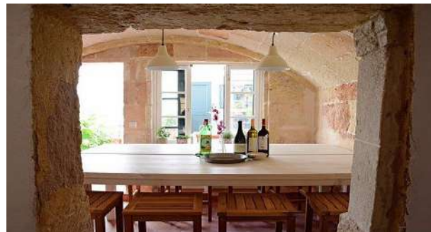
Cuk - Cuk. Ciutadella.