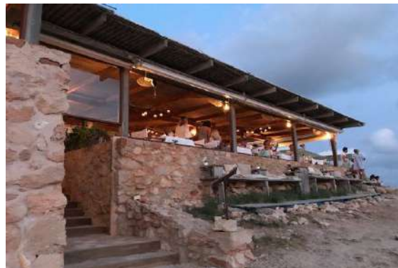
Molí de Sal.