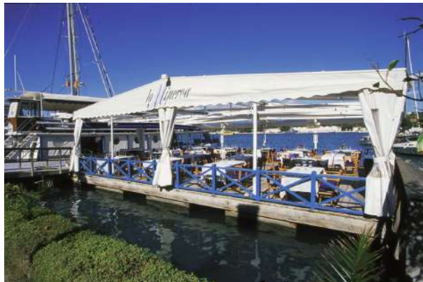
La Minerva. Mahón.