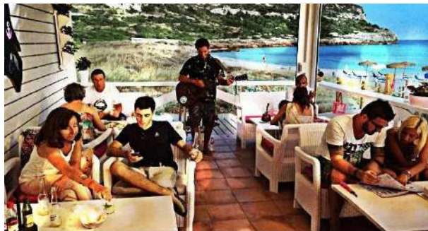
Es Corb Marí. Alaiar.