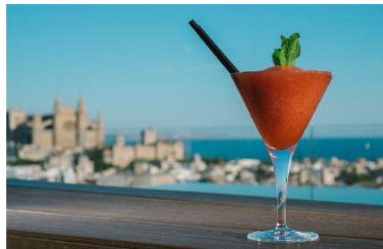
Nakar Rooftop. Palma.